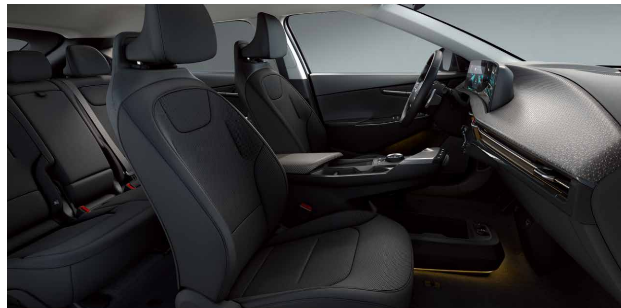
EV6 - Interni in tessuto ed eco pelle

Dal velluto morbido e resistente, all'ecopelle fino ai materiali riciclati: il design ergonomico di Kia EV6 è pensato per il comfort del corpo e la tranquillità della mente. Ecologia e sostenibilità. Non è solo una questione di stile. Si tratta di un nuovo modo di essere.