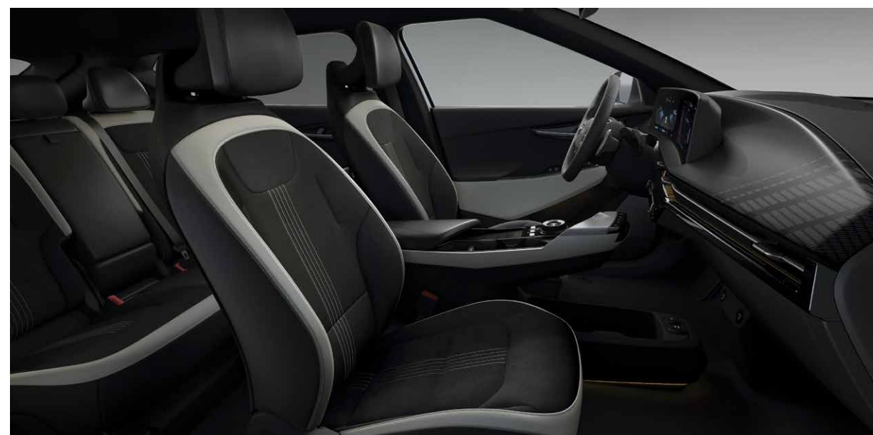
EV6 GT-line - Interni in tessuto scamosciato e pelle vegana