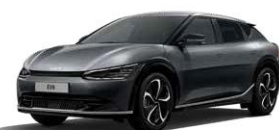
Interstellar Gray (AGT)*