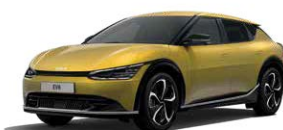
Urban Yellow (UBY)*