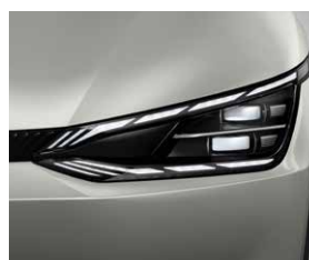
Fari full LED con fascio adattivo intelligente

Le informazioni relative agli pneumatici inerenti i consumi e altri parametri ai sensi del Regolamento UE 2020/740 sono disponibili sul nostro sito, all'indirizzo www.kia.com/it/ . Le informazioni riportate sugli pneumatici hanno puramente carattere informativo.