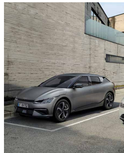
Safe Exit Assist (SEA). Quando un passeggero apre una porta per uscire dall'abitacolo, un segnale acustico lo avvisa nel caso in cui stia sopraggiungendo un veicolo da dietro. La funzione contribuisce anche a mantenere la porta posteriore chiusa con la sicurezza per i bambini.

L'obiettivo della nostra tecnologia è rendere ogni viaggio migliore, più divertente e più rilassante.