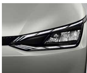
Fari full LED con tecnologia a riflessione