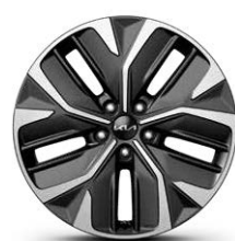
Cerchi in lega da 19"