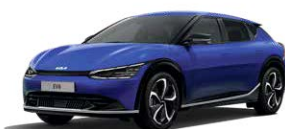
Yacht Blue (DU3)