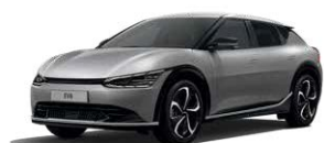
Steel Gray (KLG)*