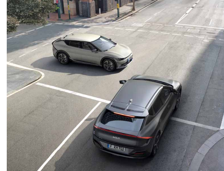
Forward Collision-Avoidance Assist (FCA) con funzione svolta e incrocio. Il sistema FCA sfrutta una telecamera frontale e un radar per rilevare veicoli, pedoni o ciclisti che precedono. Grazie alla funzione automatica di segnalazione e frenata contribuisce a evitare incidenti o ridurne la gravità. Il sistema interviene inoltre durante l'attraversamento o la svolta agli incroci.