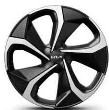
Cerchi in lega da 20" (GT Line)