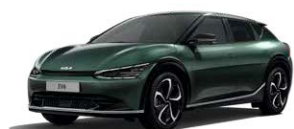
Deep Forest (G4E)*